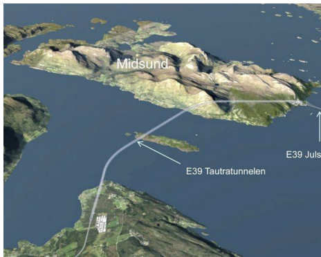
Samler kreftene: De tre fylkene Møre og Romsdal, Vestland og Rogaland står sammen i kravet om mer penger til utbygging av Vestlandsvegen E39. Fjordkryssinga av Romsdalsfjorden, Møreaksen, er blant strekningene som har godkjent reguleringsplan, men som ikke har kommet inn på prioritert plass i Nasjonal Transportplan.