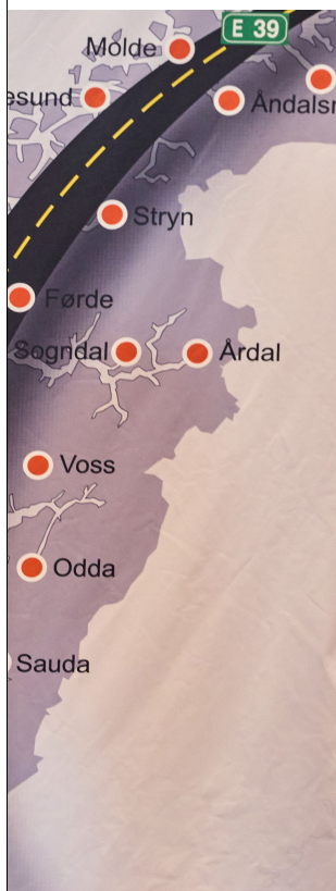
med kollegaene Jon Askeland (Vestland)

nomslag for å bygge en bedre E39. «Ti velmente råd» kalte Hanssen dette: