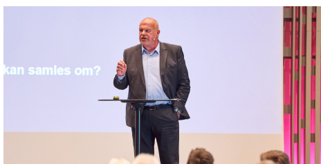
Bli enig: - Den største trusselen mot nasjonalt gjennomslag, er lokal uenighet, var ett av de 10 rådene tidligere statsråd Bjarne Håkon Hanssen ga til deltakerne på konferansen om E39 i Bergen denne uka.