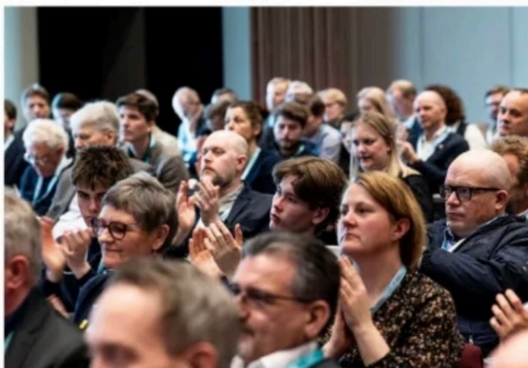
Det var stinn brakke på det som etter hvert kunne minne om et vekkesemote i regi av Vestlandsrådet, et et politisk samarbeidsråd for Vestland, Rogaland og Møre og Romsdal.